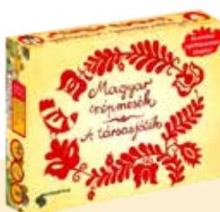
MAGYAR NÉPMESÉK - A TÁRSASJÁTÉK BD-1083

MÉG TÖBB TÁRSAS A WWW.TANESZKOZ.HU OLDALON!