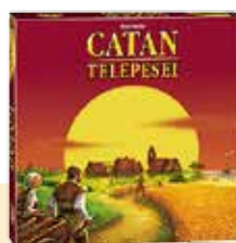
CATAN TELEPESEI TÁRSASJÁTÉK PI_772696