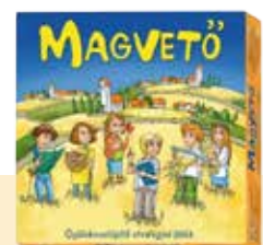
MAGVETŐ TÁRSASJÁTÉK BD_MAGVETO